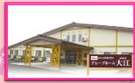
グループホーム大江 〒990-1101 大江町大字左沢536-1 TEL: 0237-62-6615 FAX: 0237-62-6616