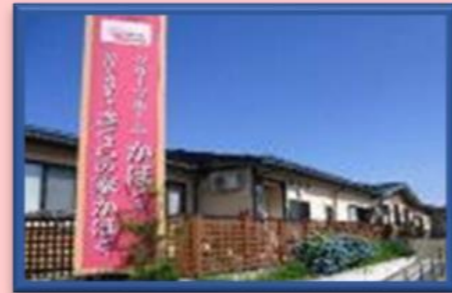
グループホームかほく 〒999-3511 河北町谷地字砂田207-1 TEL: 0237-71-1201 FAX: 0237-71-1202