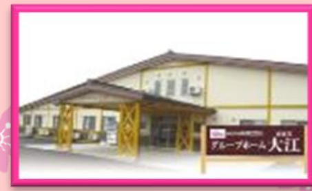
グループホーム大江 〒990-1101 大江町大字左沢536-1 TEL: 0237-62-6615 FAX: 0237-62-6616