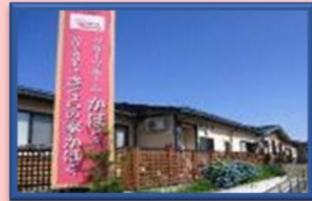
グループホームかほく 〒999-3511 河北町谷地字砂田207-1 TEL: 0237-71-1201 FAX: 0237-71-1202