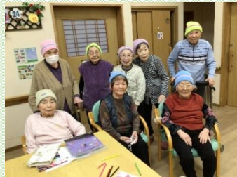
クリスマス会を行いました。 プレゼントの帽子をかぶり、 笑顔で記念写真♪