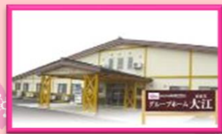
グループホーム大江 〒990-1101 大江町大字左沢536-1 TEL: 0237-62-6615 FAX: 0237-62-6616